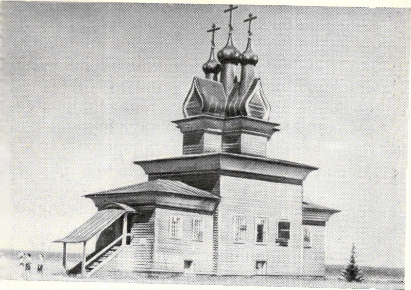
Древняя церковка на берегу Вычегды