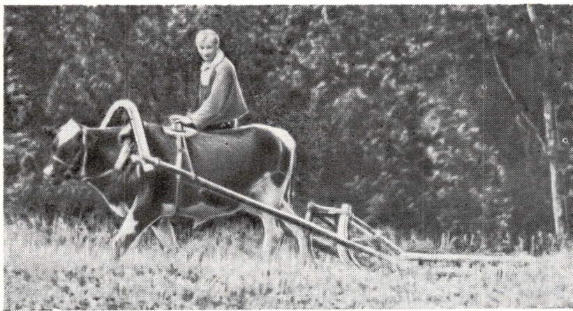
Бык — вместо лошади, сани — вместо телеги. На севере порой без такого транспорта не обойтись