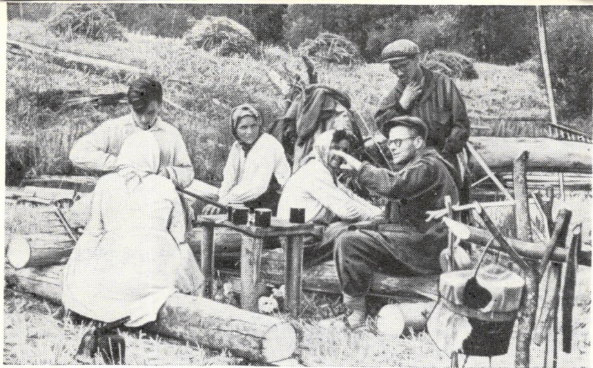
Встреча с косцами на берегу канала