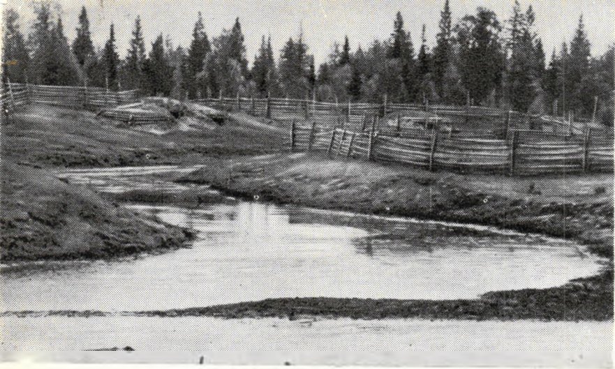
Место встречи Северной Кельтмы (вверху) и Северо-Екатерининского канала