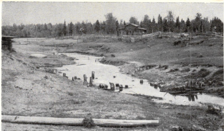
Канал у деревни Канава