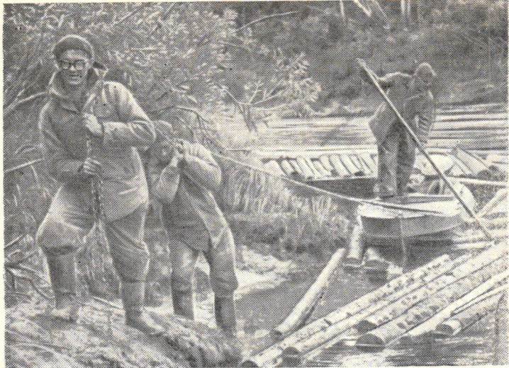
Затор на Вишерке