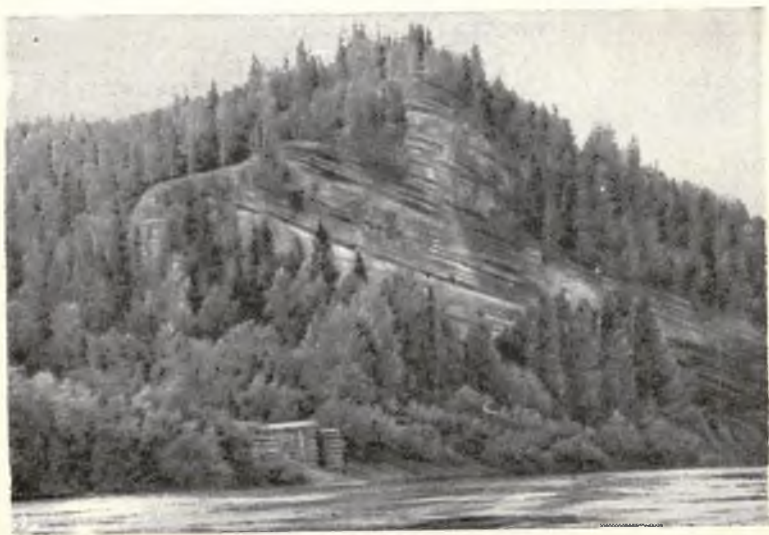
Камењ Дивљи на Колве