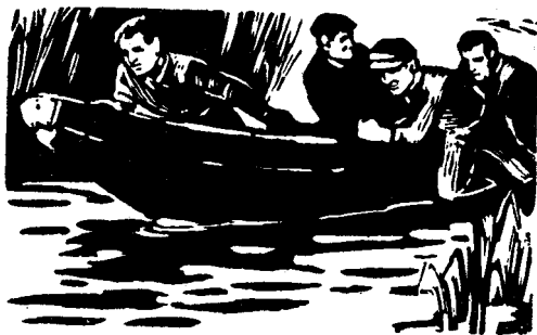
По старому каналу

рактен тем, что здесь порой из одних и тех же болот берут начало речки, текущие в разные моря. Но все же такой «казус», когда одна и та же речка несет свои воды в два моря сразу, найти трудно.