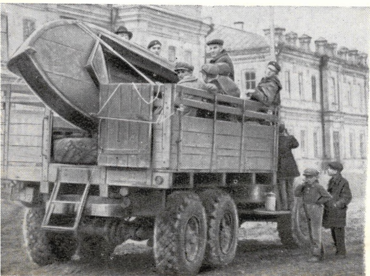
В путь на Ольховку