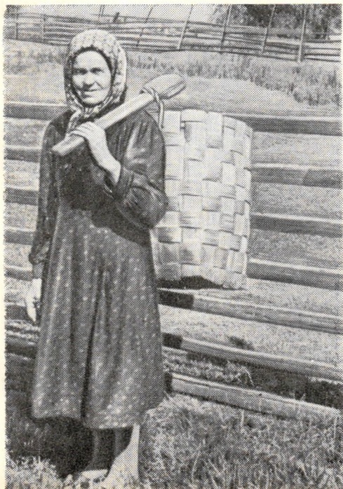
Для северного жителя пестерь незаменим