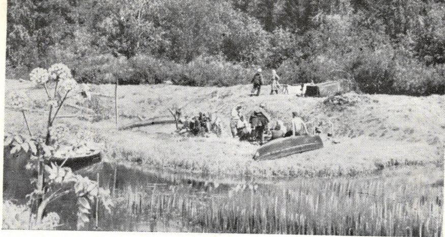
Место, откуда воды таежного Джурича расходятся в две морские системы — Белого моря (слева) и Каспийского