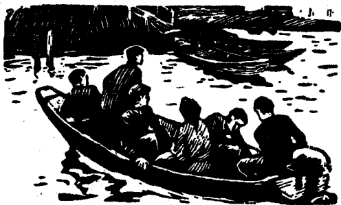
Путь на Вычегду

Проведя в деревне несколько часов и поблагодарив гостеприимных хозяев за радушие и помощь, мы вывели лодку в Северную Кельтму, которая в этих местах, у Канавы, имеет довольно невзрачный вид: и узка, и мелка. Путь по ней предстоял немалый. До ближайшей деревни Кирды сорок километров, от нее до следующего населенного пункта — еще сто двадцать.