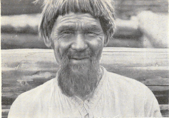
Один из кана- винских ста- рожилов