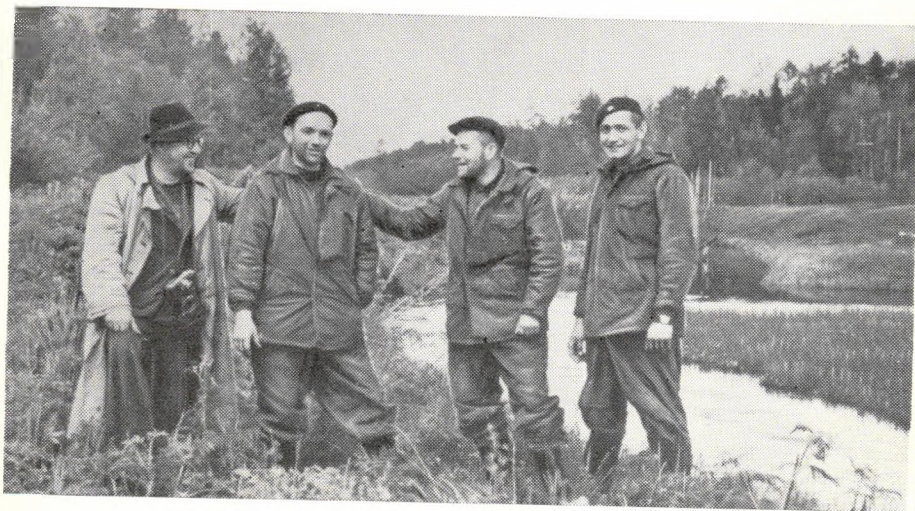
У входа в Сесеро-Екатерининский канал